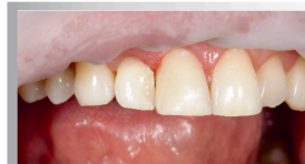
Aplikacja Opaquera / krok 2