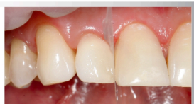
Wypełnienie Zenchroma / krok 3