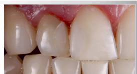
Przed / krok 1

Przy odbudowach klasy III i IV, w sytuacji ograniczonego otaczającego uzębienia, zaleca się stosowanie materiału Zenchroma wraz z OPAQUER jako materiału uzupełniającego. Funkcją OPAQUER jest ograniczenie wpływu ubytku na dopasowanie koloru (shade matching).